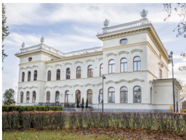
Näsilinna Museo Milavida.